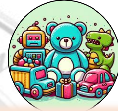
Kanyang mga laruan