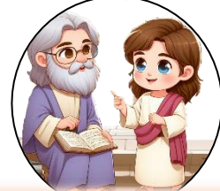
Nakinig at nagtanong sa guro

5. Patungkol kanino ang itinaturo ng mga guro sa Templo nang naroon si Jesus?