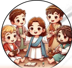
Kanyang mga kaibigan

5. Patungkol kanino ang itinaturo ng mga guro sa Templo nang naroon si Jesus?