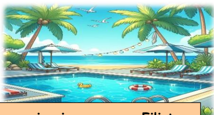
nag-swimming ang mga Filisteo

4. Ano ang ginawa ng mga Filisteo matapos mahuli si Samson?