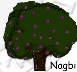
Nagbibigay ng Kaalaman

3. Sino ang tumukso kay Eba upang kainin ang bunga?